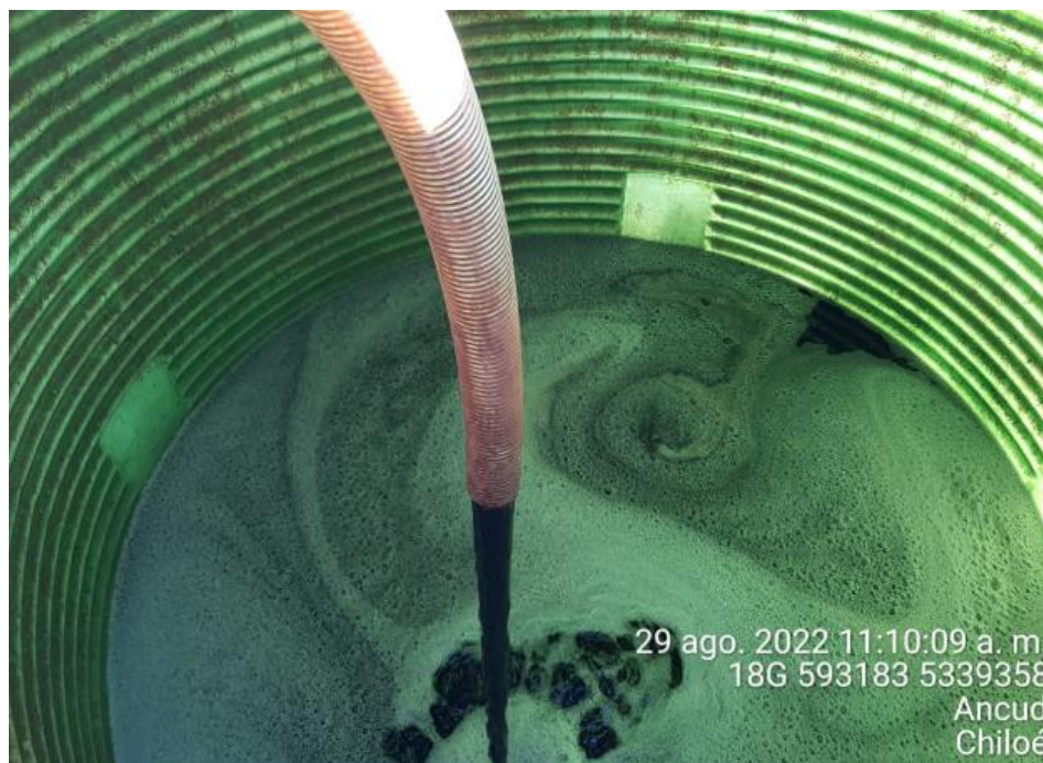
Fotografía N°2: Extracción de Lixiviados a estanque por personal municipal. Tomada: Lunes 29 de Agosto del 2022.