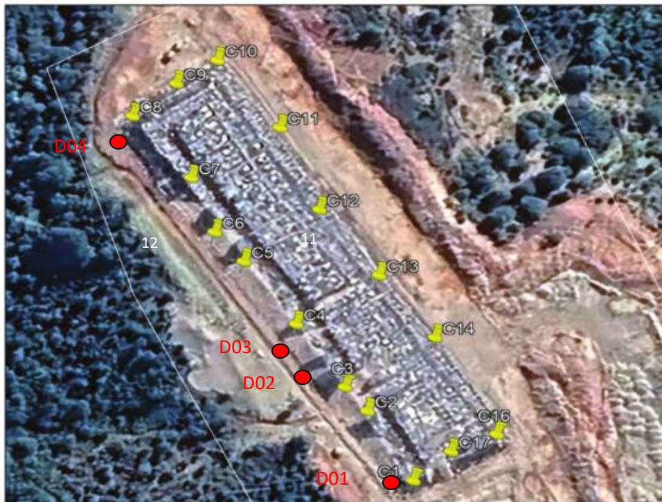
Fotografía N°18: Zanja Sanitaria N°1. Imagen Aérea I. Municipalidad de Ancud.

Se adjunta imagen donde se encuentra personal de Municipal realizando mediciones de cámaras de monitoreo de sobrecelda. Se realiza misma técnica de medición de cámaras realizada en terreno por la SMA al momento de inspeccionar el recinto sanitario.