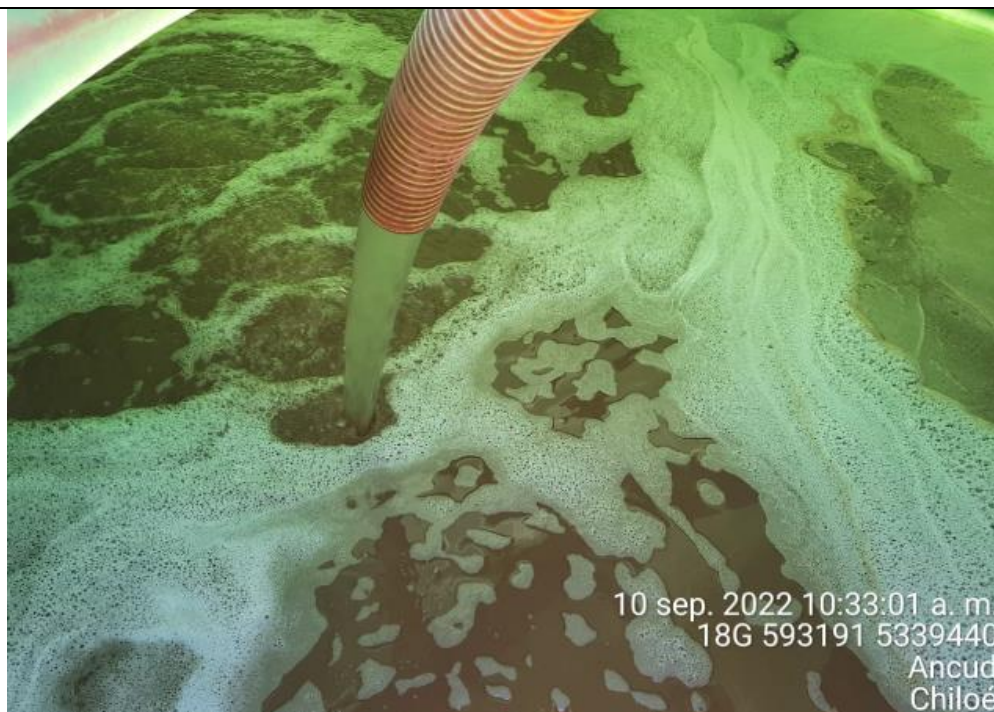
Fotografía N°17: Extracción de Lixiviados a estanque. Tomada: Sábado 10 de Septiembre del 2022.