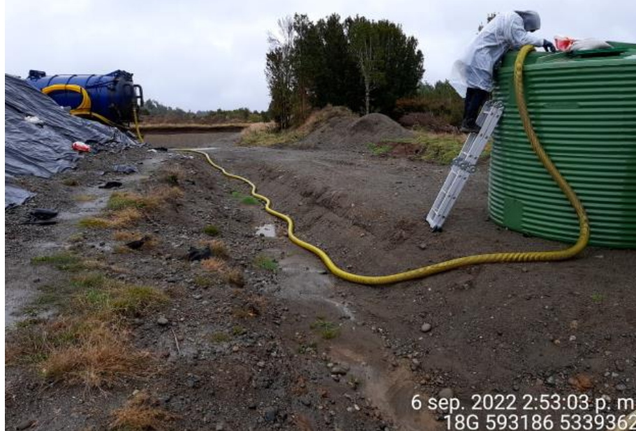
Fotografía N°12: Retiro de Lixiviados de empresa Tresol Tomada: Martes 06 de Septiembre del 2022.