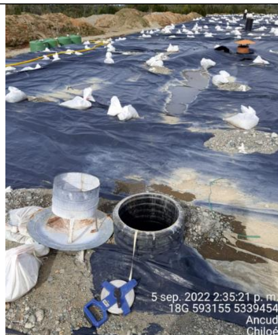
Fotografía N°25: Medición de Niveles de cámaras por Personal Municipal. Tomada: 05 de Septiembre del 2022.