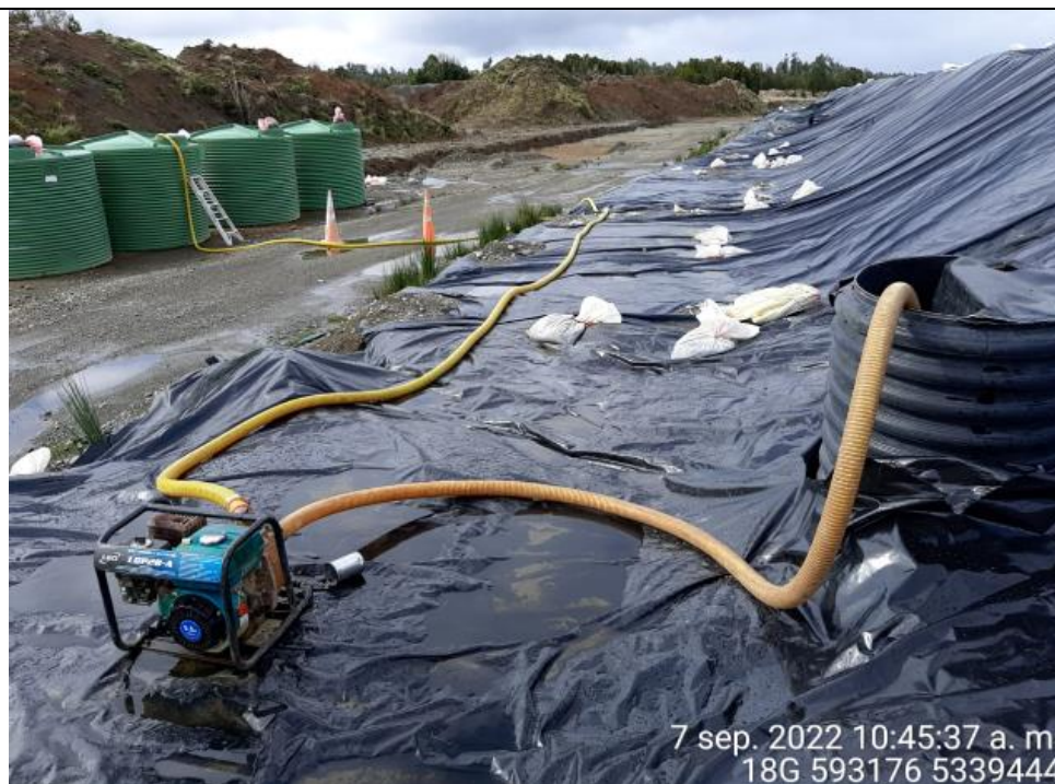
Fotografía N°13: Extracción de Lixiviados desde diagonal D2 Tomada: Miércoles 07 de Septiembre del 2022.