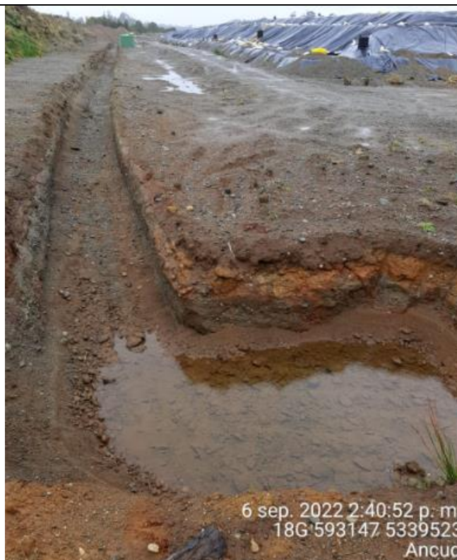
Fotografía N°38: Estado canales aguas lluvias