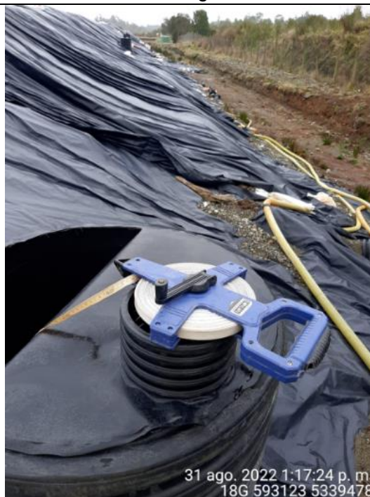
Fotografía N°21: Medición de Niveles de cámaras por Personal Municipal. Tomada: 31 de Agosto del 2022.