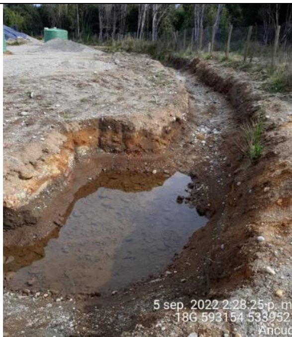
Fotografía N°37: Estado canales aguas lluvias