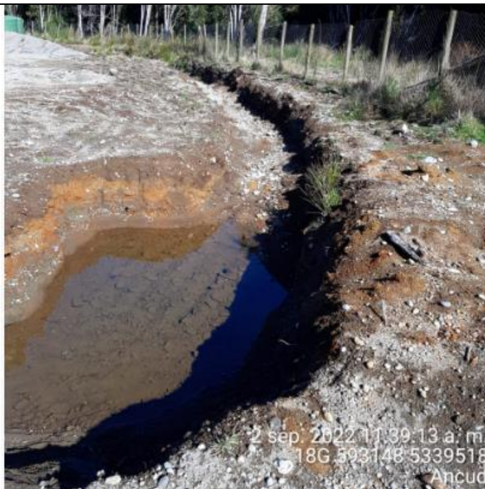
Fotografía N°35: Estado canales aguas lluvias