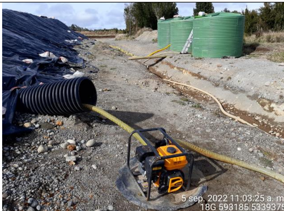
Fotografía N°10: Extracción de Lixiviados desde diagonal D02. Tomada: Lunes 05 de Septiembre del 2022.