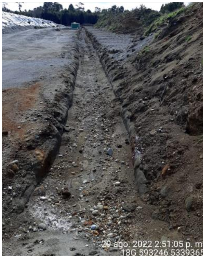
Fotografía N°31: Estado canales aguas lluvias

Los canales de aguas lluvias ya se encuentran contruidos y limpios. Se adjuntan las fotografías del estado de los canales perimetrales ilustrando el estado de ellos.