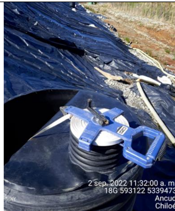
Fotografía N°23: Medición de Niveles de cámaras por Personal Municipal. Tomada: 02 de Septiembre del 2022.