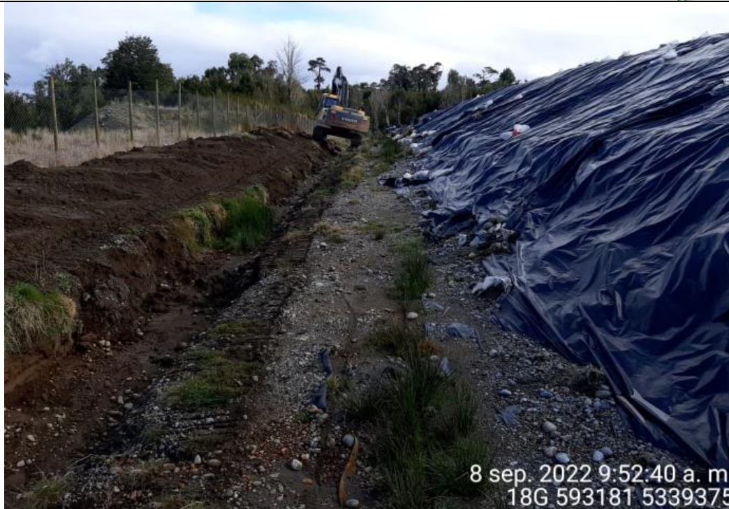
Fotografía N°40: Estado canales aguas lluvias