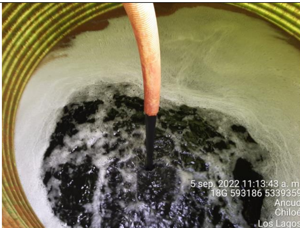
Fotografía N°11: Extracción de Lixiviados a estanque. Tomada: Lunes 05 de Septiembre del 2022.