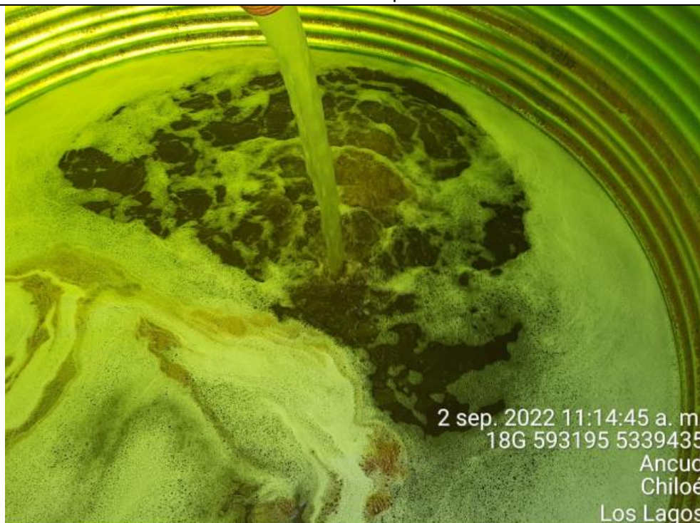
Fotografía N°9: Extracción de Lixiviados a estanque por personal municipal. Tomada: Viernes 02 de Septiembre del 2022.