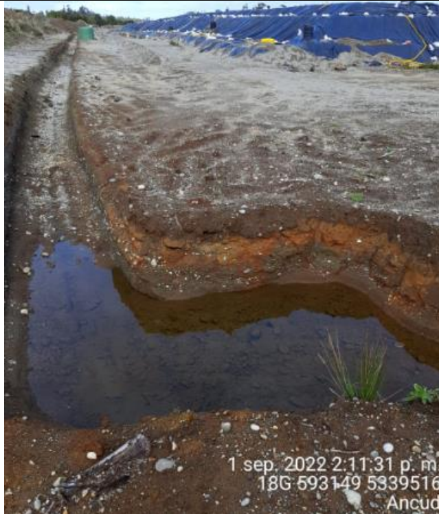
Fotografía N°34: Estado canales aguas lluvias