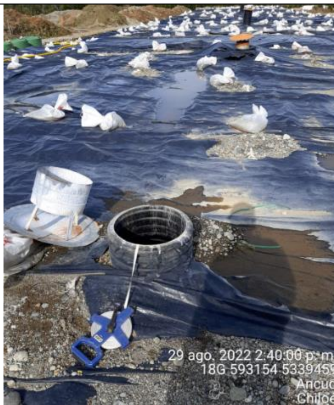
Fotografía N°19: Medición de Niveles de cámaras por Personal Municipal. Tomada: 29 de Agosto del 2022.