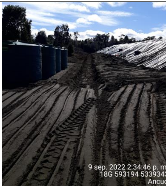
Fotografía N°41: Estado canales aguas lluvias