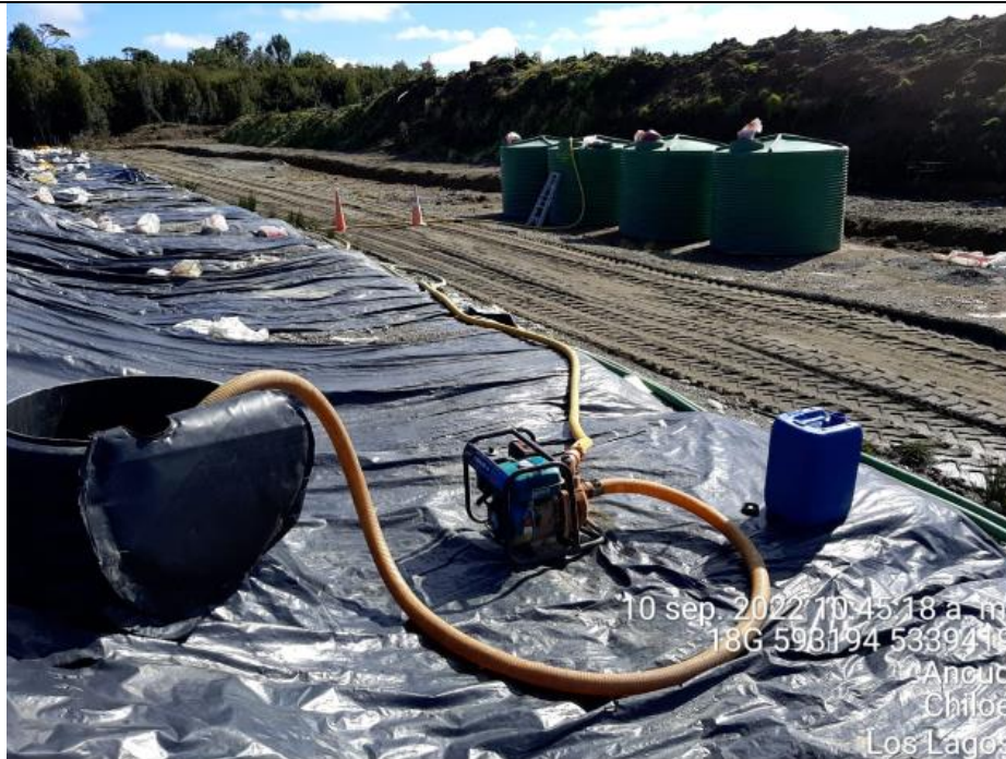
Fotografía N°16: Extracción de Lixiviados cámara C13. Tomada: Sábado 10 de Septiembre del 2022.