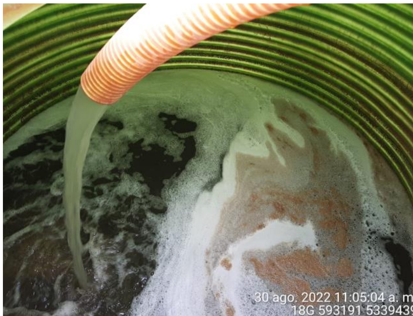
Fotografía N°5: Extracción de Lixiviados a estanque por personal municipal. Tomada: Martes 30 de Agosto del 2022.