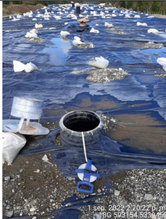
Fotografía N°22: Medición de Niveles de cámaras por Personal Municipal. Tomada: 01 de Septiembre del 2022.