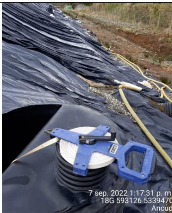
Fotografía N°27: Medición de Niveles de cámaras por Personal Municipal. Tomada: 07 de Septiembre del 2022.