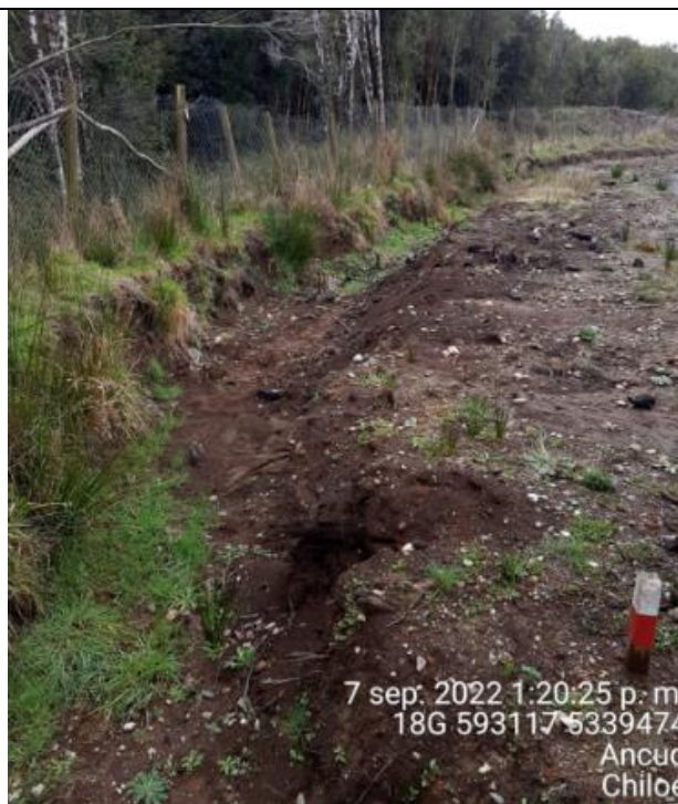
Fotografía N°39: Estado canales aguas lluvias