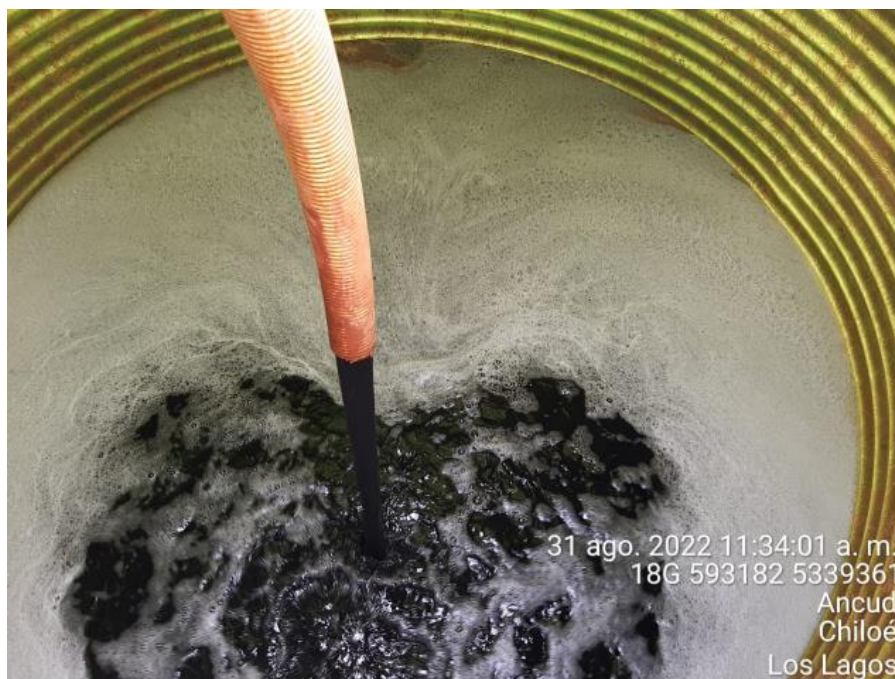
Fotografía N°7: Extracción de Lixiviados a estanque por personal municipal. Tomada: Miércoles 31 de Agosto del 2022.