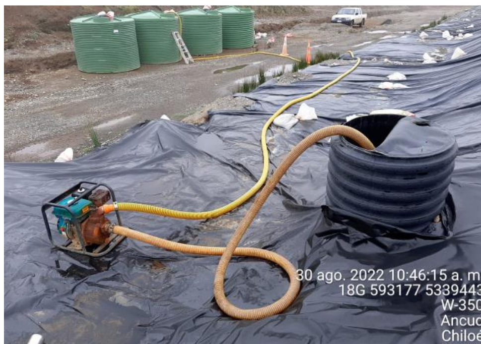
Fotografía N°3: Extracción de Lixiviados desde cámara C12 por personal municipal. Tomada: Martes 30 de Agosto del 2022.