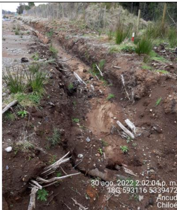
Fotografía N°32: Estado canales aguas lluvias