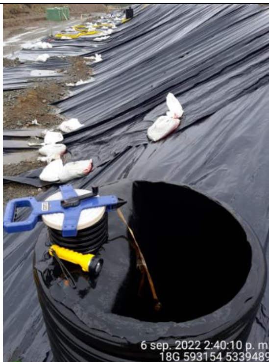
Fotografía N°26: Medición de Niveles de cámaras por Personal Municipal. Tomada: 06 de Septiembre del 2022.