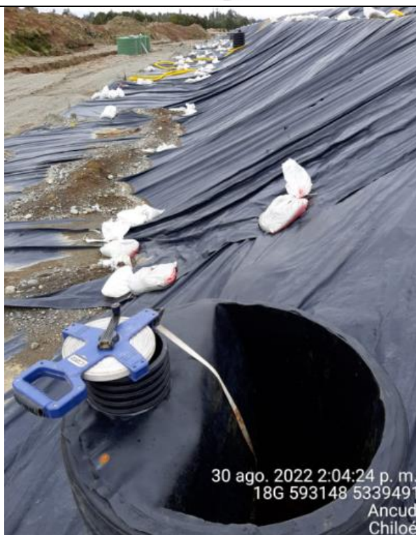
Fotografía N°20: Medición de Niveles de cámaras por Personal Municipal. Tomada: 30 de Agosto del 2022.