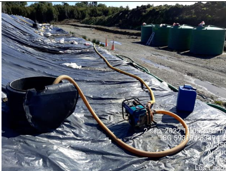
Fotografía N°8: Extracción de Lixiviados desde cámara C13 por personal municipal. Tomada: Viernes 02 de Septiembre del 2022.