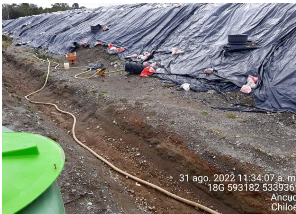
Fotografía N°6: Extracción de Lixiviados desde diagonal D02. Tomada: Miércoles 31 de Agosto del 2022.