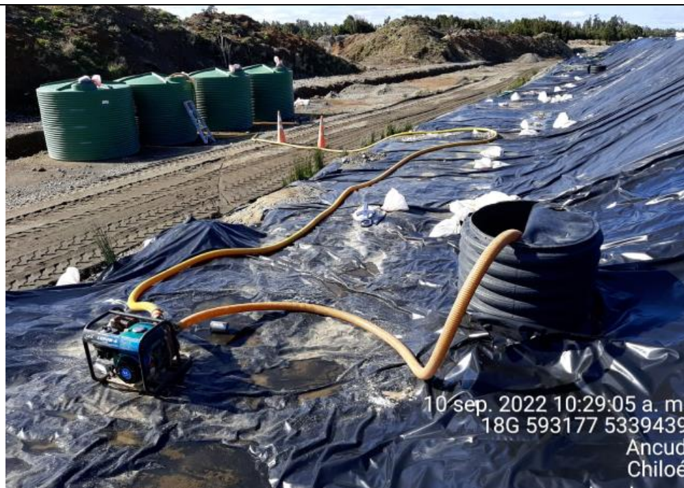
Fotografía N°15: Extracción de Lixiviados cámara C12. Tomada: Sábado 10 de Septiembre del 2022.