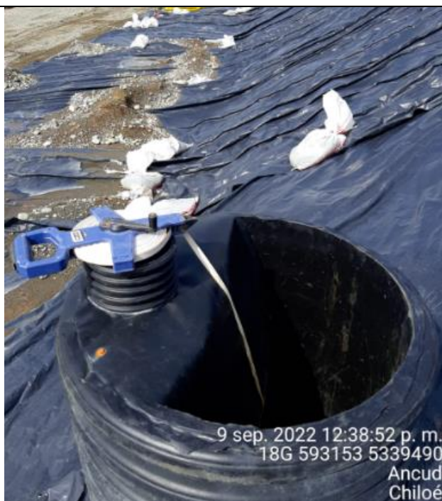
Fotografía N°29: Medición de Niveles de cámaras por Personal Municipal. Tomada: 09 de Septiembre del 2022.