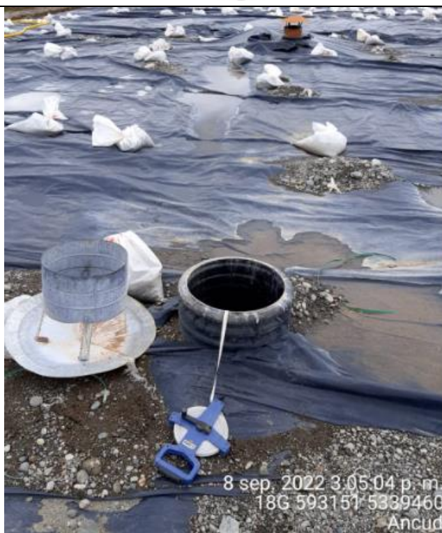
Fotografía N°28: Medición de Niveles de cámaras por Personal Municipal. Tomada: 08 de Septiembre del 2022.