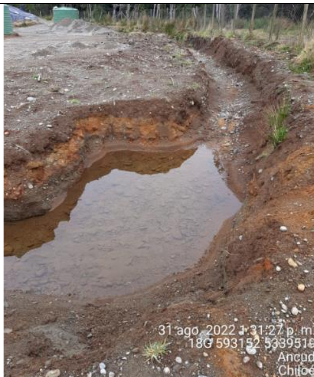
Fotografía N°33: Estado canales aguas lluvias