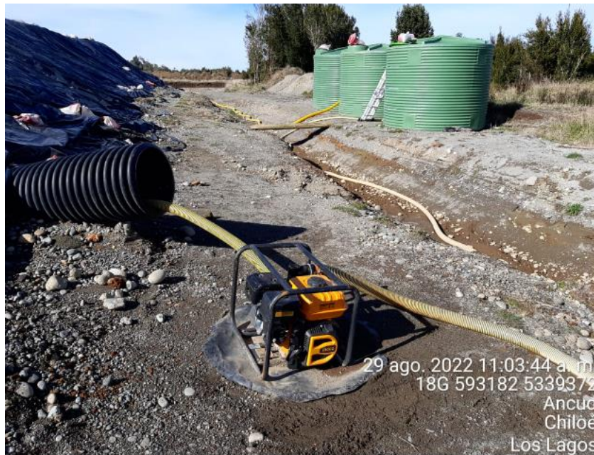
Fotografía N°1: Extracción de Lixiviados desde diagonal D02. Tomada: Lunes 29 de Agosto del 2022.

A continuación, se presenta el registro fotográfico de las actividades de extracción del periodo del 29 de Agosto al 11 de Septiembre del 2022.