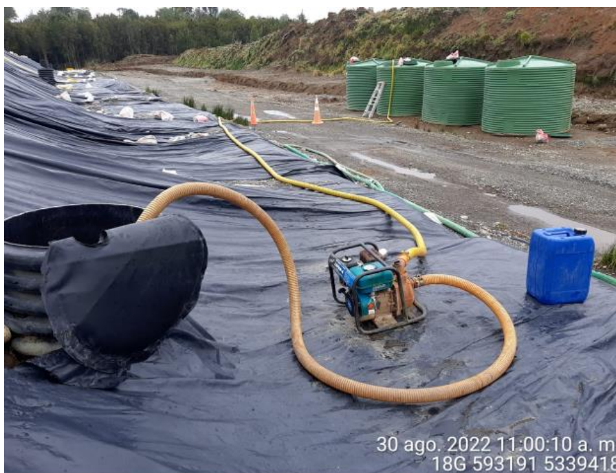
Fotografía N°4: Extracción de Lixiviados desde cámara C13 por personal municipal. Tomada: Martes 30 de Agosto del 2022.