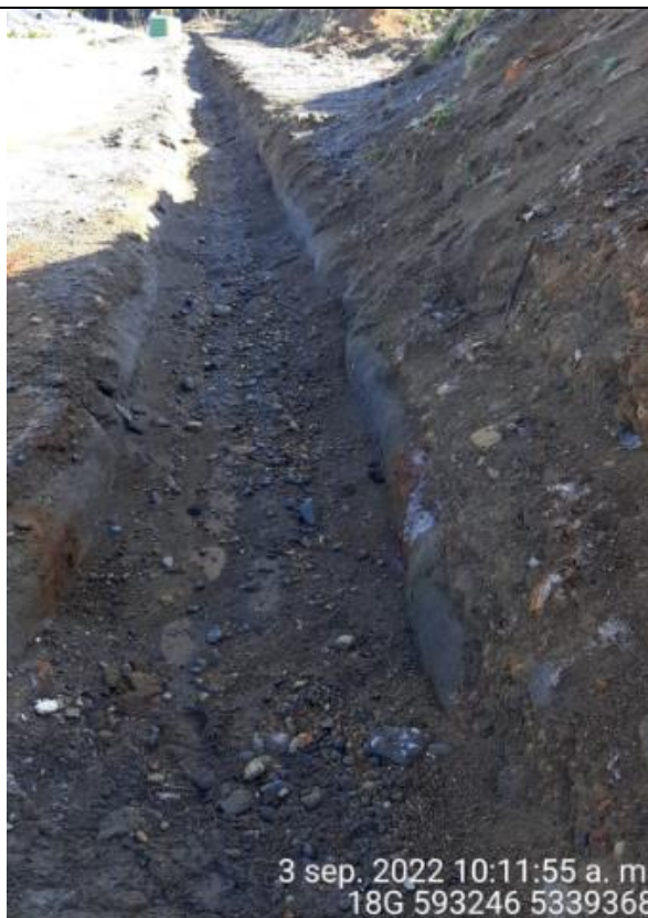
Fotografía N°36: Estado canales aguas lluvias